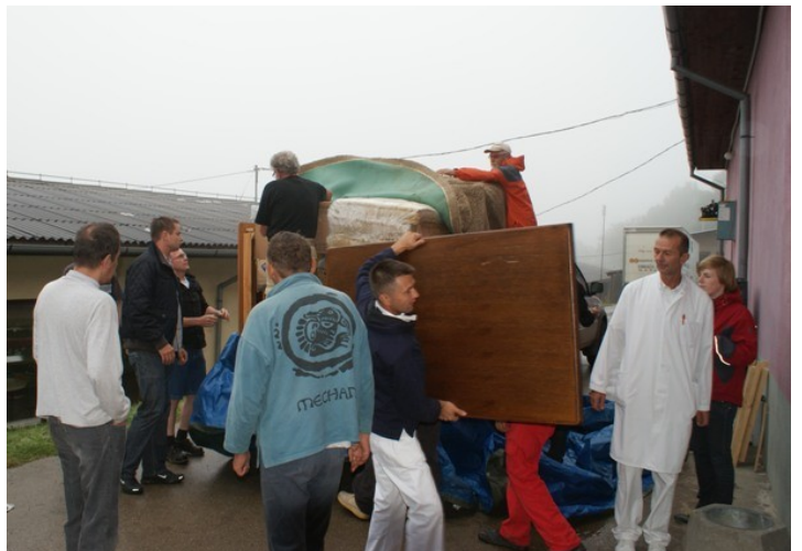
Hulpgoederen lossen bij het verpleeghuis van Doboj.