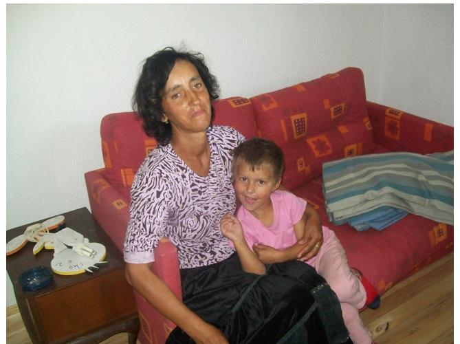
Van kaal beton naar een leefbare woonkamer met keukenblok

Maar dat we in ieder geval een goed begin hebben gemaakt, laat zich zien in de blijde kindergezichtjes als ze voor het eerst op hun bank zitten en in de vele kussen die ik van de moeder krijg als we vertrekken. Kussen die eigenlijk voor de mannen bedoeld waren, want die hebben hier in twee dagen tijd een flinke klus geklaard.